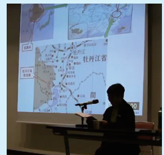
体験談を語る「帰国者」