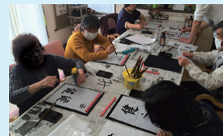
レクリエーションの様子